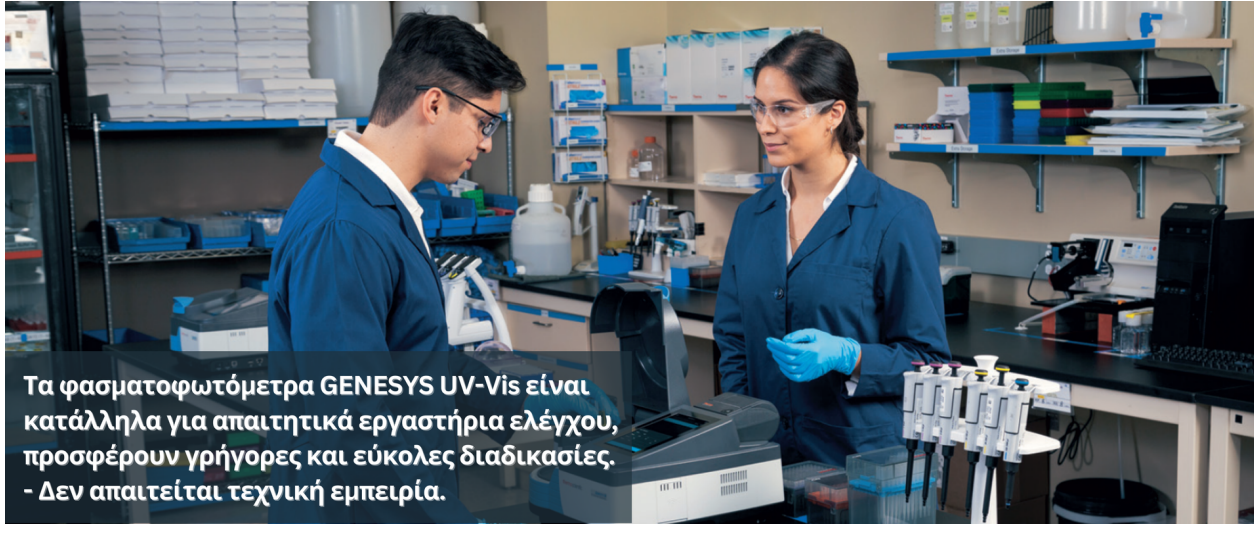
Τα φασματοφωτόμετρα GENESYS UV-Vis είναι κατάλληλα για απαιτητικά εργαστήρια ελέγχου, προσφέρουν γρήγορες και εύκολες διαδικασίες, - Δεν απαιτείται τεχνική εμπειρία.

Είσαστε έτοιμοι για ένα φασματοφωτόμετρο GENESYS™ Visible ή UV-Vis; Επιτρέψτε μας να σας βοηθήσουμε να κάνουμε την απόφασή σας ευκολότερη. Τώρα είναι η ώρα να αγοράσετε. Ζητείστε τις εκπαιδευτικές μας προσφορές και αναβαθμίστε το εργαστήριό σας σήμερα.